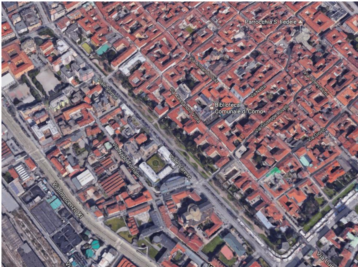
Figura 1: Vista aerea 3D su Viale Varese

L'area di progetto risulta essere Viale Varese, cioè una delle strade più percorse, fra macchine e pedoni, in tutta Como, città di circa 85 mila abitanti (quinto comune della regione Lombardia per popolazione) e famosa specialmente per il suo Lago omonimo, distante circa 350 metri dall'area interessata ai lavori.