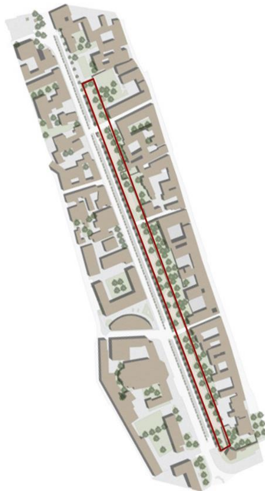
Figura 2: Planimetria generale dell'area di progetto con evidenziata l'area del parco urbano